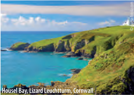
Housel Bay, Lizard Leuchtturm, Cornwall