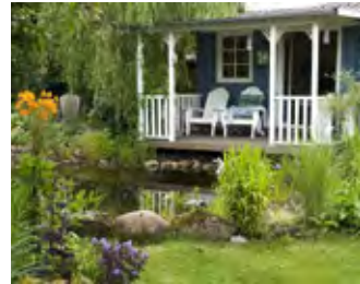
Veranstalter ist die Josef Kottenstedte GmbH