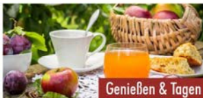
Genießen & Tagen