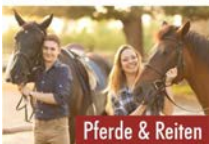
Pferde & Reiten