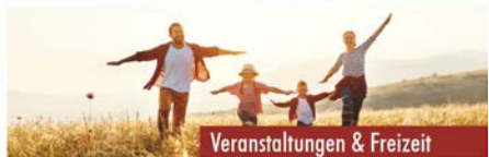
Veranstaltungen & Freizeit