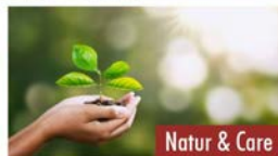
Natur & Care